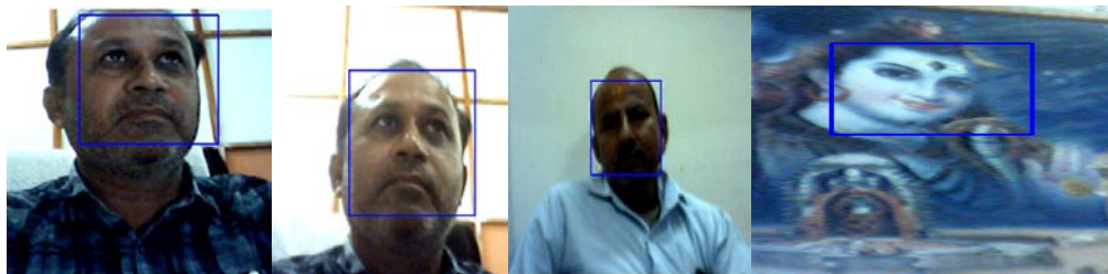
(a)Face landmark boundary

To implement our proposed system, we use OpenCV, haar cascade frontal face for image processing, and dlib package for machine learning.